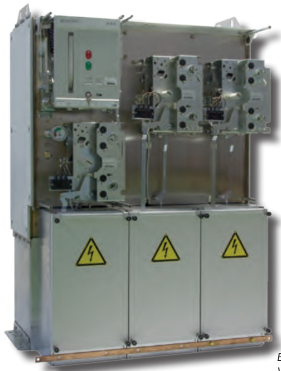
ECOSMART GIS - Vista interna