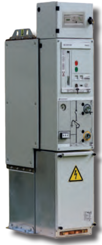
ECOSMART GIS - Unità singola con cassettoni di bassa tensione

Tutte le apparecchiature installate all'interno del pannello (interruttori di manovra sezionatori, interruttori e fusibili) possono essere smontati per consentire la manutenzione.