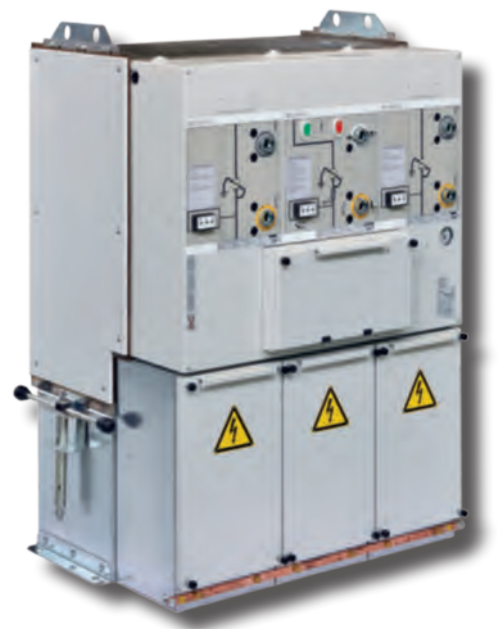
ECOSMART GIS - Unità multiple